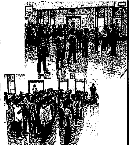
各学年、感謝の気持ちを込めて、6年生に歌や合奏をプレゼント