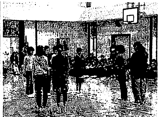
6年生から5年生に、校旗が引き継がれました