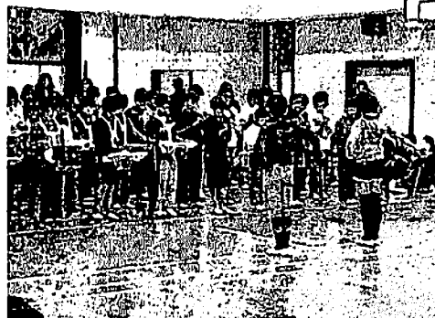
6年生から鼓笛隊を引き継ぎ、演奏をする5年生