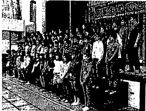
6年間、筈小を支えてくれた6年生

6年生を送る会から、1年生は6年生の気持ちで、4年生は感謝の気持ちをこめてプレゼントをした。5年生は、6年生から伝統ある校旗と、鼓笛隊を引き継ぎました。