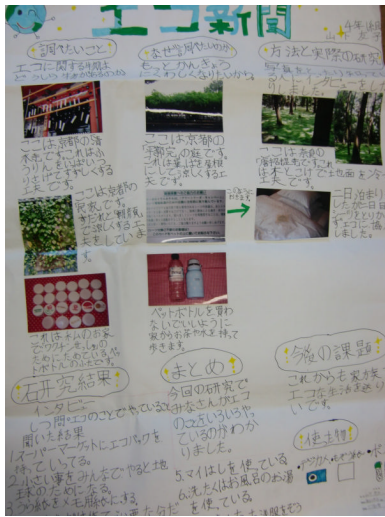
取材をもとに新聞作り